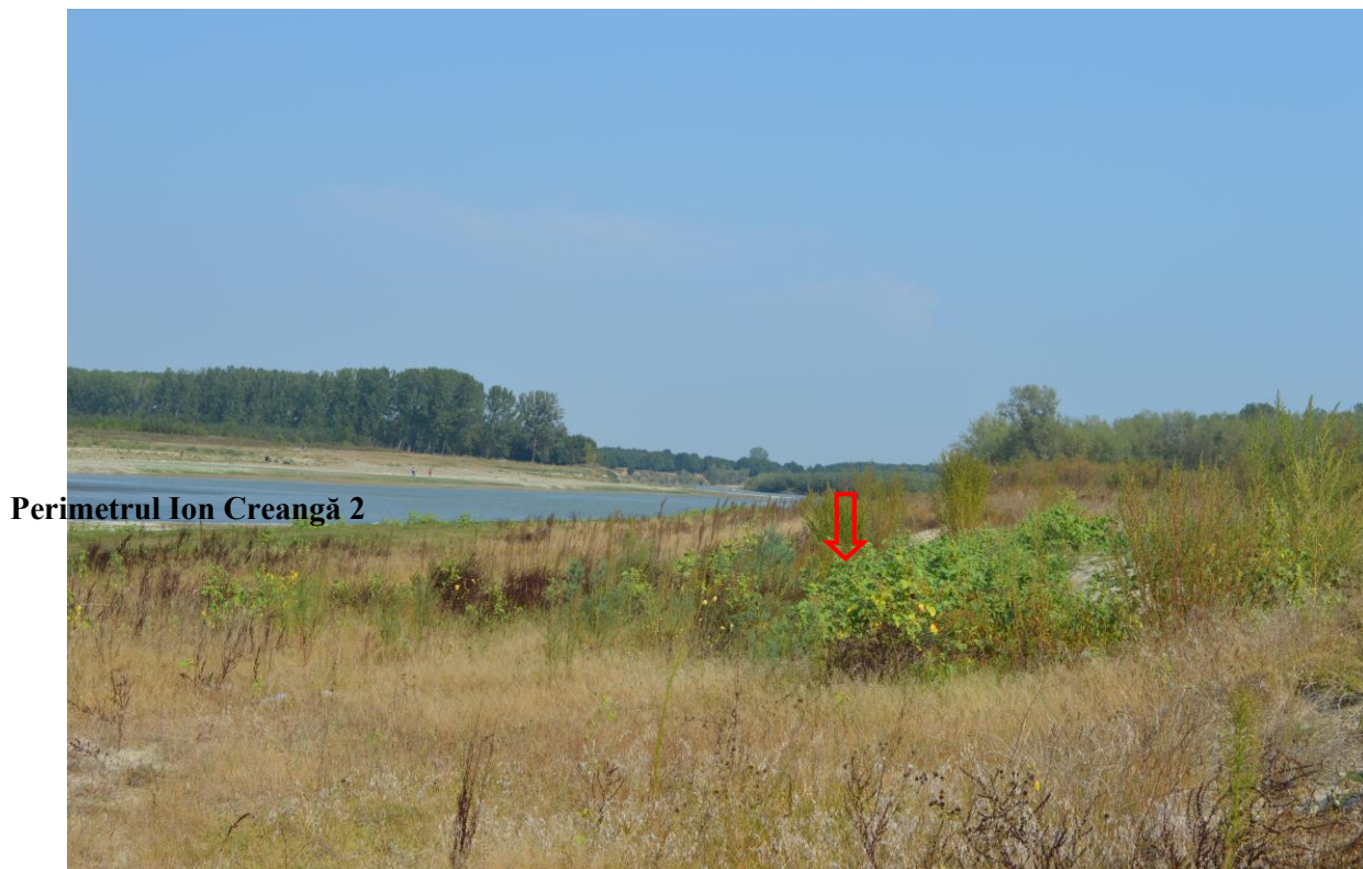
Suprafețe acoperite cu specii ierboase pionere stabilite pe depozite litologice acoperite cu o copertă redusă de sol, pe malul stâng în vecinătatea perimetrului de exploatare Ion Creangă 2