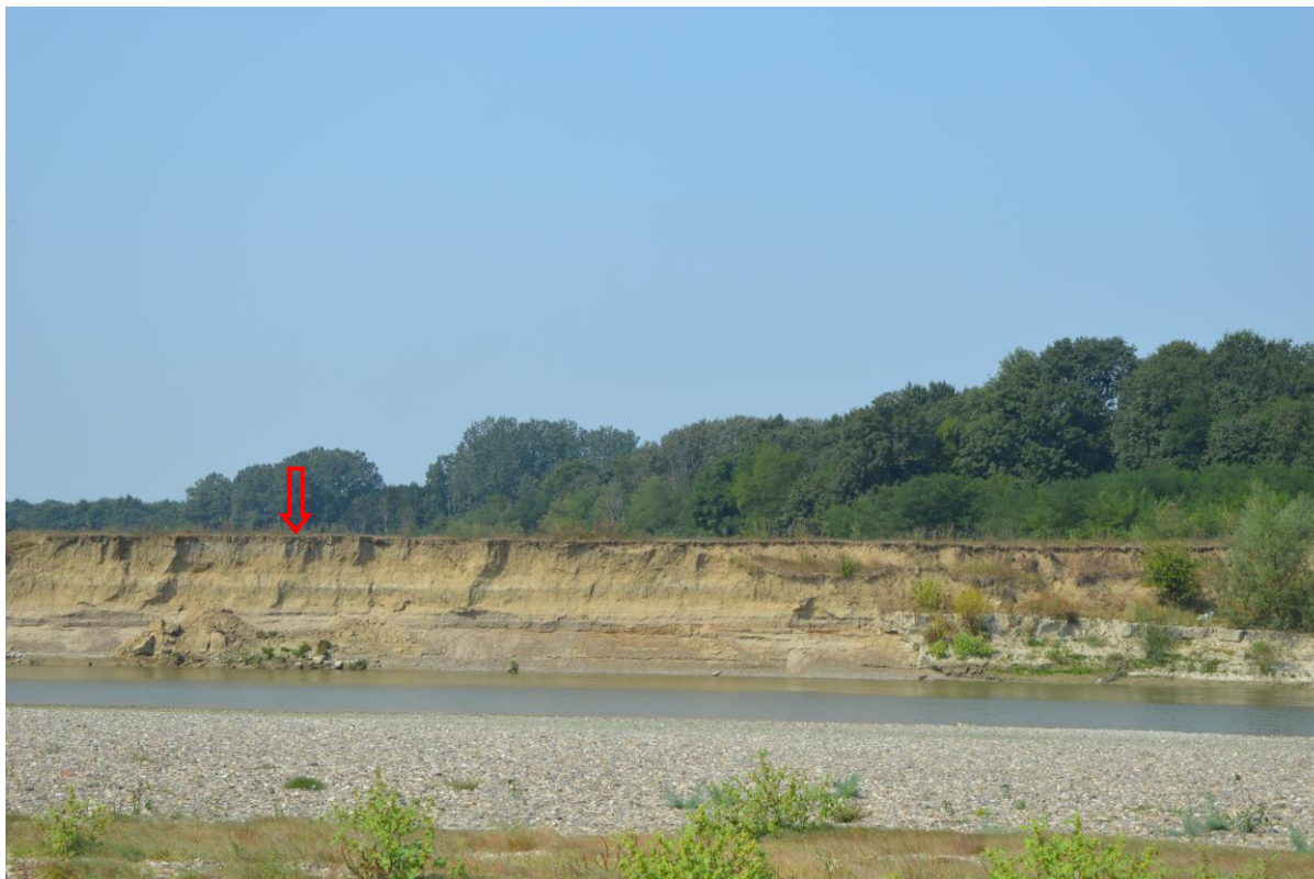
Eroziune activă mal drept în dreptul perimetrului Ion Creangă 2

Exploatarea agregatelor minerale pe amplasamentul propus are efect benefic asupra regularizării râului Siret, pe porțiunea respectivă realizându-se: