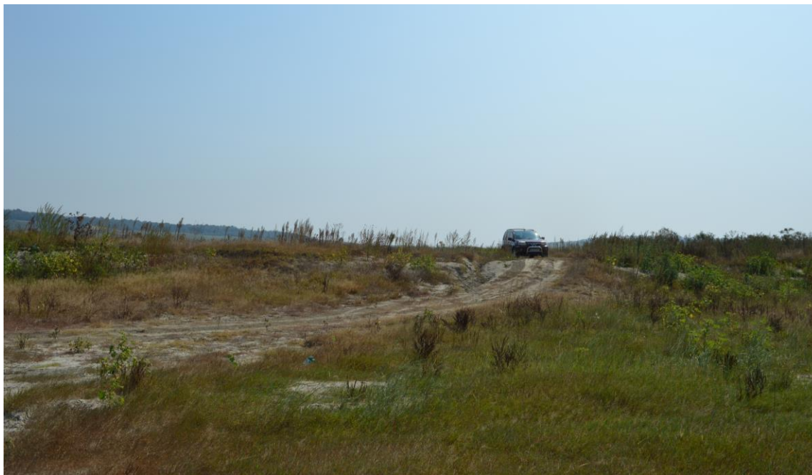
Aspectul vegetației suprafețelor înierbate din vecinătatea perimetrului Ion Creangă 2

Deoarece pe suprafața perimetrului Ion Creangă 2 nu există copertă de sol, suprafața sa nu a fost colonizată de specii ierboase iar sursele de hrană necesare și accesibile păsărilor sunt foarte reduse, ceea ce face ca și diversitatea și abundența speciilor să fie de asemenea redusă. Lipsa vegetației de pe suprafața perimetrului face ca speciile de păsări să nu prefere această zonă pentru odihnă și cuibărit.