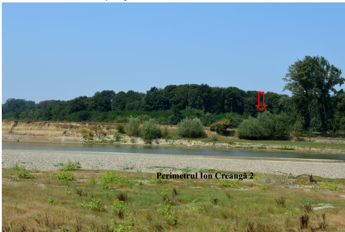
Habitat de zăvoi cu Salix alba și Populus alba de pe malul drept al râului Siret, în dreptul perimetrului Ion Creangă 2