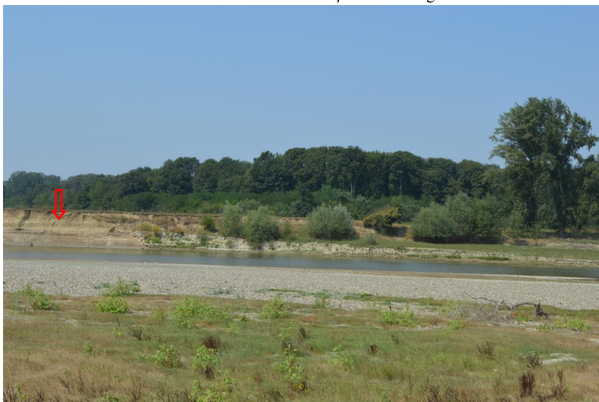
Eroziune mal drept în dreptul perimetrului Ion Creangă 2

Extragerea agregatelor minerale din albia minoră a râului Siret, în perimetrul Ion Creangă 2 este necesară pentru asigurarea scurgerii debitului la ape mari, cu efect benefic asupra comunității din zonă datorită faptului că această activitate reduce riscul de eroziune al malului drept la viituri, fenomene care afectează structura habitatelor din zonă și terenurile agricole riverane.