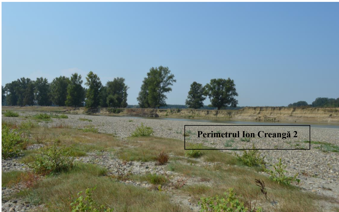
Perimetrul Ion Creangă 2 în condiții de secetă