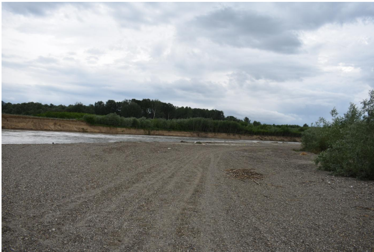
Habitat de zăvoi cu Salix alba și Populus alba de pe malul stâng al râului Siret, din zona amplasamentului Hârlești amonte 2

Tipul de habitat Natura 2000 identificat pe malul drept, în vecinătatea zonei de implementare a proiectului este 92A0 – „Zăvoaie cu Salix alba și Populus alba ”, care corespunde în clasificarea națională habitatului R4405 – “Păduri daco-getice de plop negru ( Populus nigra ) cu Rubus caesius ”. Acest tip de habitat este frecvent în luncile de deal și de câmpie din toată țara, în zona pădurilor de stejar, la altitudini de 50 – 300 m.