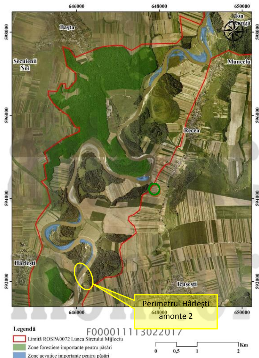
Anexa nr. 25 la Planul de management - Zone importante pentru speciile de păsări de interes conservativ, observate în ROSPA0072 Lunca Siretului Mijlociu – detaliu zona sudică: Recea-Hârlești

Considerăm că impactul produs de proiect este negativ dar nesemnificativ, ne bazăm această estimare pe următoarele aspecte: