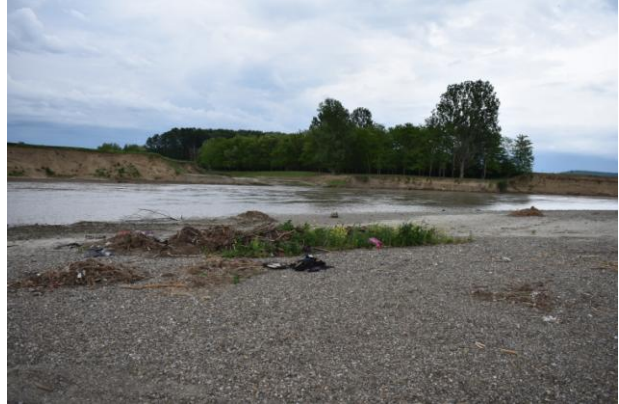
Deșeuri depozitate ilegal pe malul râului Siret, pe suprafața perimetrului Hârlești amonte 2