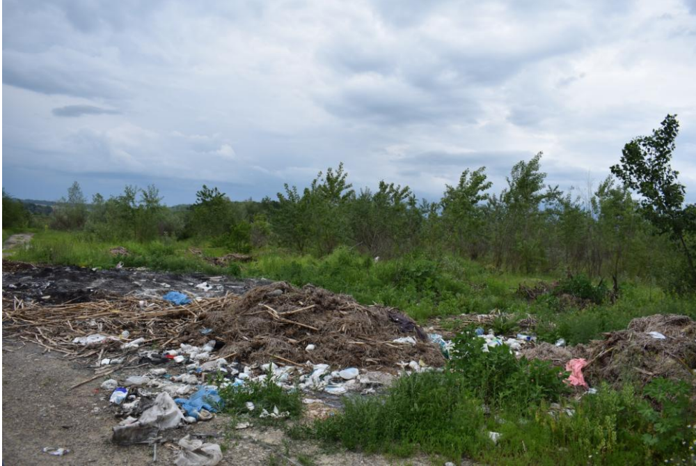
Deșeuri depozitate ilegal pe malul râului Siret, în zone cu vegetației arbustivă și arborescentă, în interiorul ROSPA 0072, de-a lungul drumului de acces în perimetrul Hârlești amonte 2