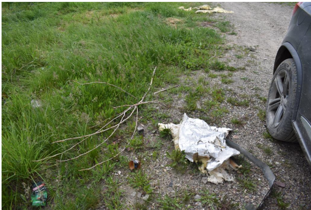
Deșeuri depozitate ilegal pe malul râului Siret, în zone cu vegetației arbustivă și arborescentă, în interiorul ROSPA 0072, de-a lungul drumului de acces în perimetrul Hârlești amonte 2