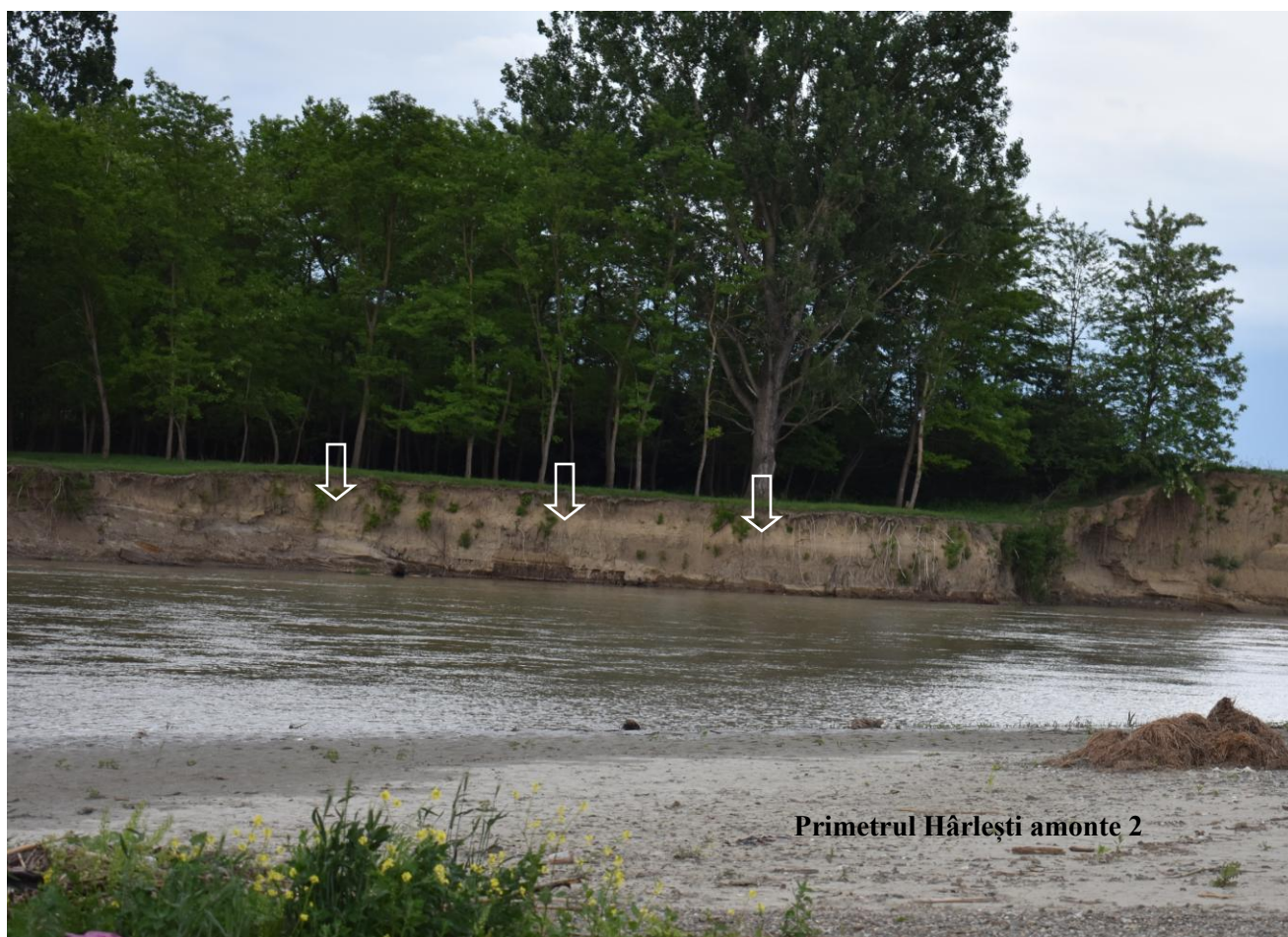
Primetrul Hârlești amonte 2

Astfel că, proiectul analizat are efecte benefice indirecte, pe termen mediu și lung, privind menținerea habitatului de pădure de luncă, preferat specii de păsări care constituie obiectivele de conservare ale ROSPA0072 Lunca Siretului Mijlociu.